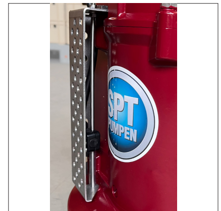
Type 215 L A avec commande d'électrodes