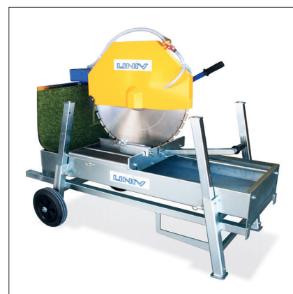
Pieds captives et rétractables