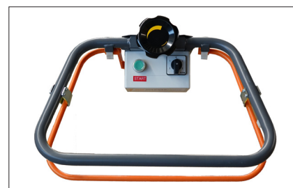
Molette pour l'inclinaison des pâles / Poignée de sécurité actionnant la machine