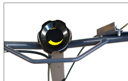
Poignée de réglage des pâles