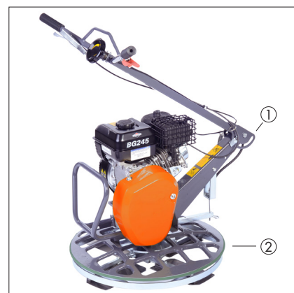
① timon articulé ② Bords relevés