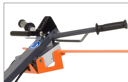
Poignée actionnent la machine