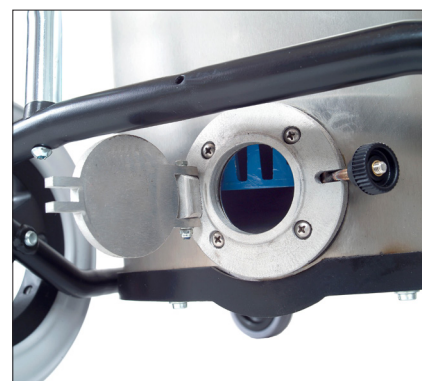
Reinigungs- und Entleerungsklappe