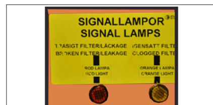
Dual-Signalleuchten: oranges Licht zeigt verstopften Filter, rotes Licht zeigt Leckage in HEPA-Filter. Akustischer Alarm bei verstopften oder defekten Filter.