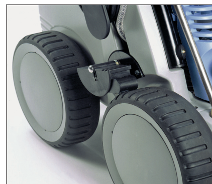
Frein excentrique d'immobilisation