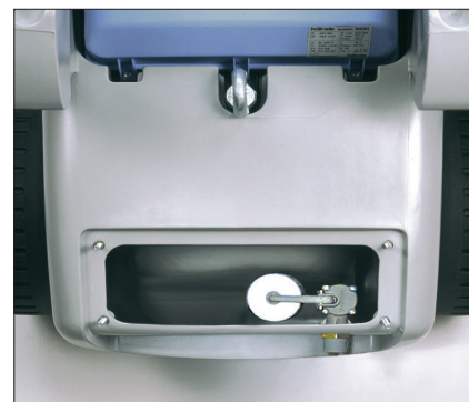
Robinet à flotteur