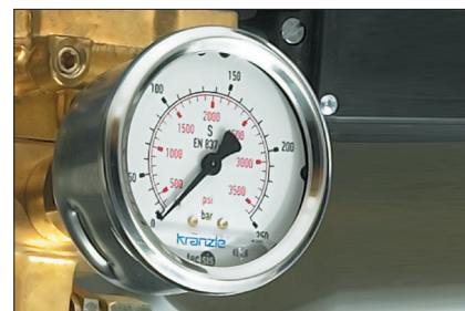
Manomètre en inox