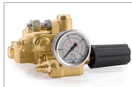
Tête de pompe en laiton spécial