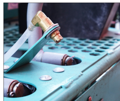
Düse / Wasserspritz-System