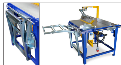
Table supplémentaire pliable