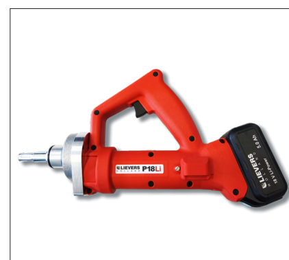
Moteur d'entraînement avec poignée ergonomique