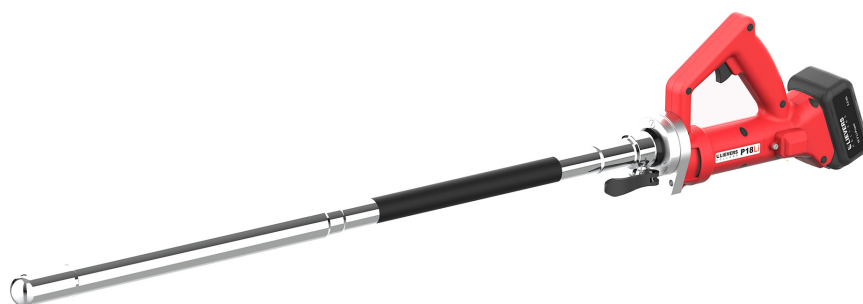
longueurs des tuyaux 0.5 - 1 m