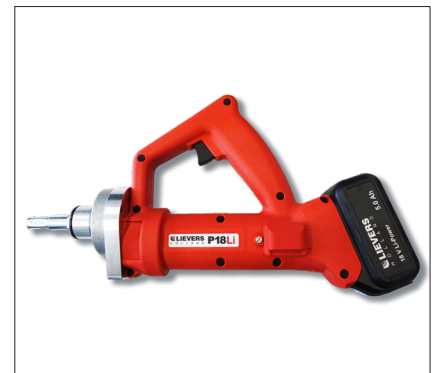
Antriebsmotor mit handlichem Griff