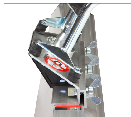
Système de fermeture rapide