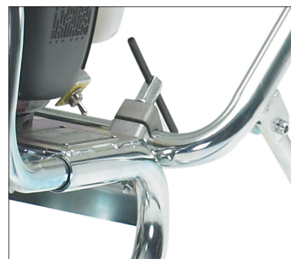
Des poignées réglables, pliable pour le transport